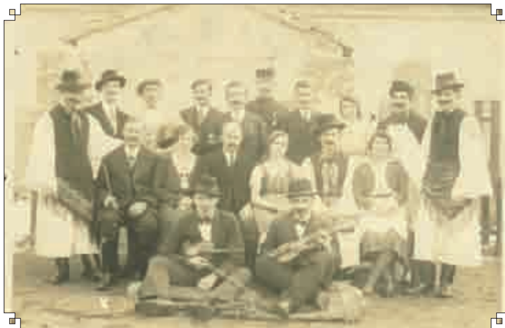
Betyárkendő című színdarab