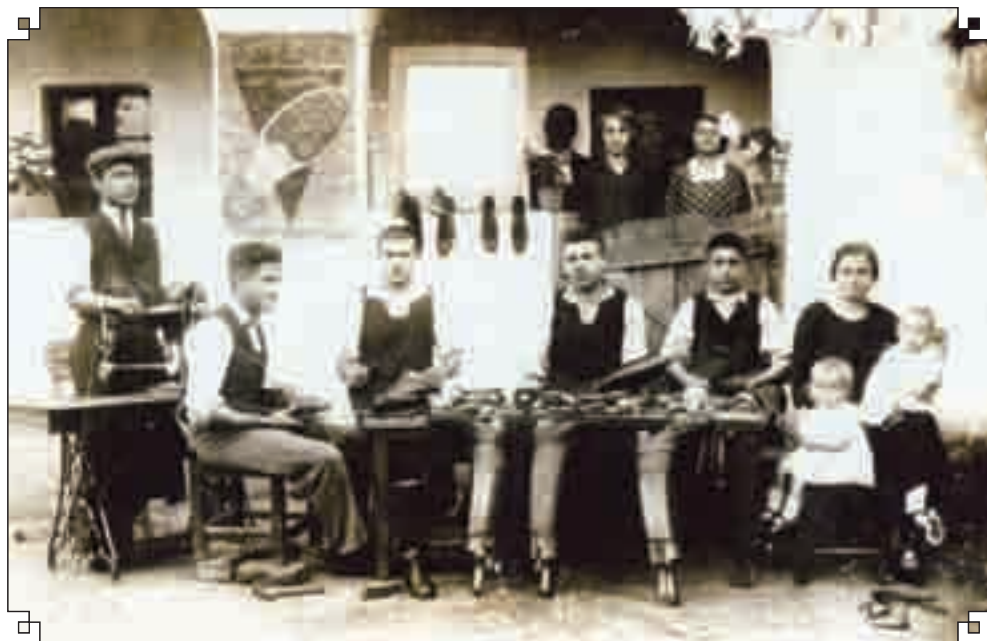
Csizmadia mesterek és tanoncok