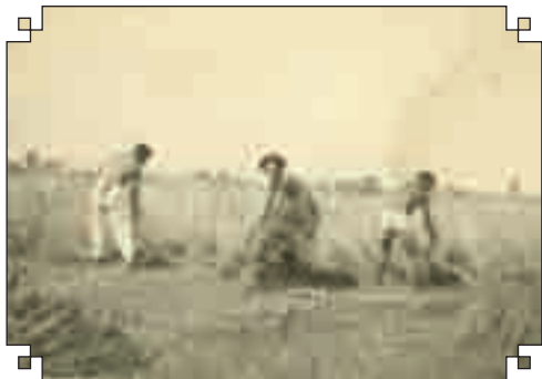
Állattartás és aratás