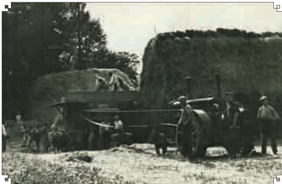
Gabona cséplése (masinálás)