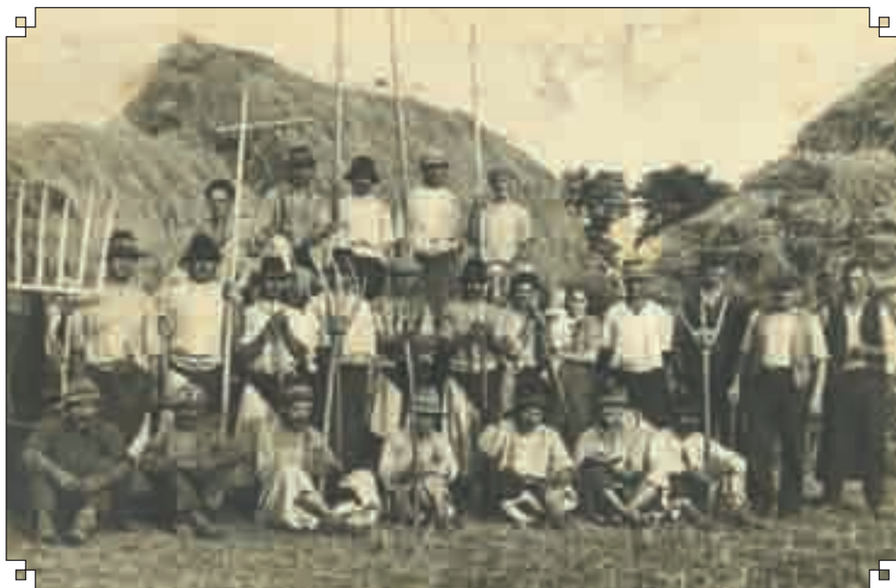
A masinálók csoportképe