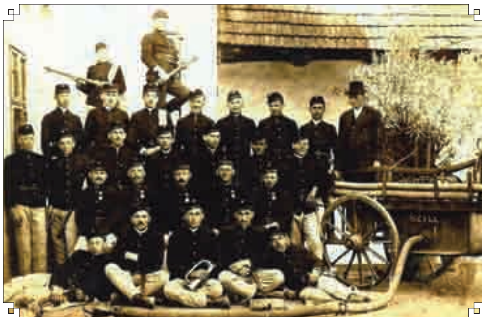
Szili tűzoltók 1932-ben