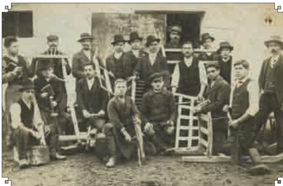
Fafaragó tanoncok 1925 körül