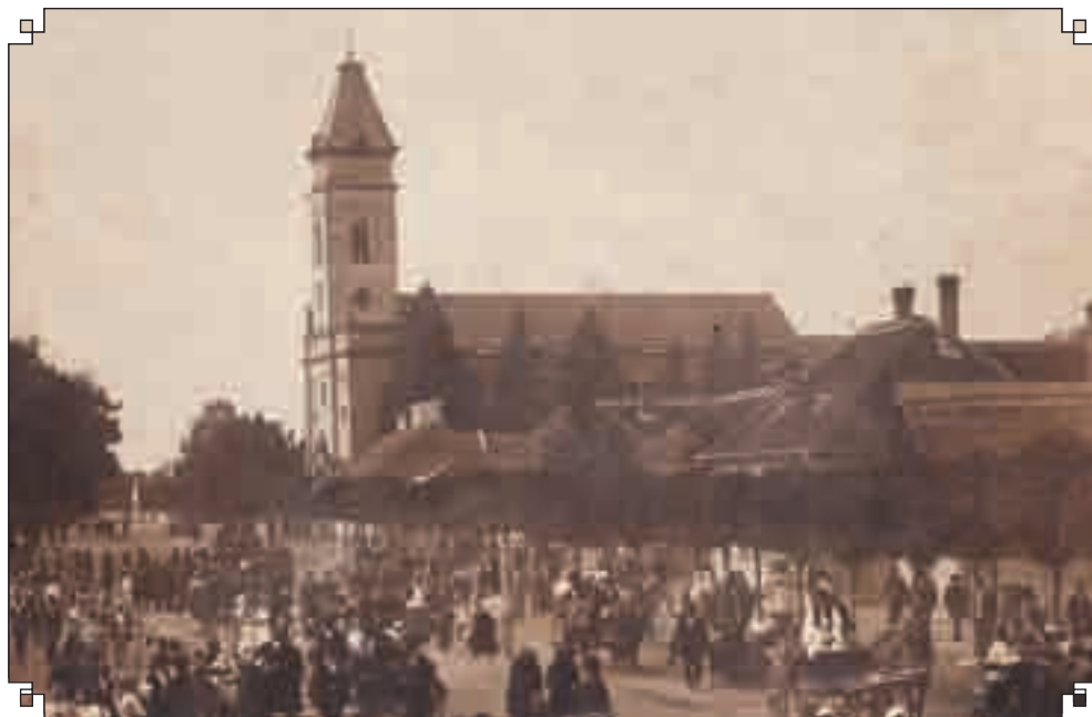
Ünnepi sokadalom