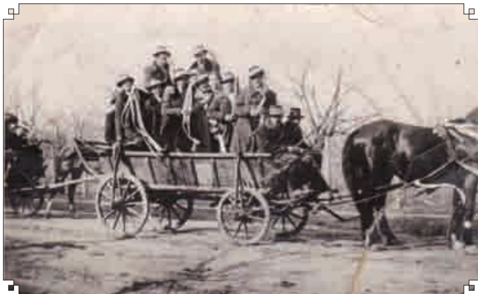
Reguták indulnak sorozásra