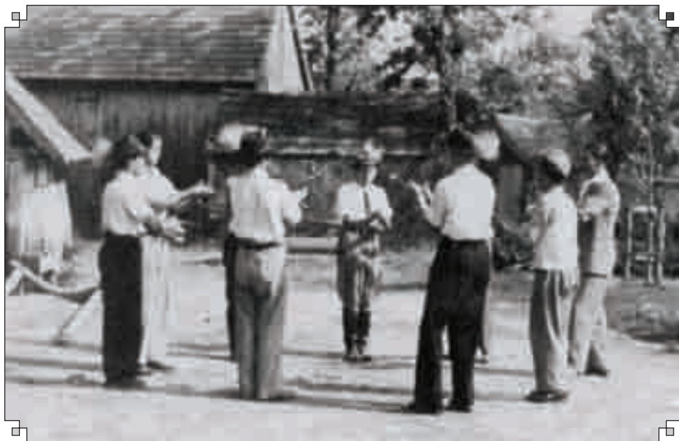
Filmfelvétel a karéj táncról (1950-es évek)