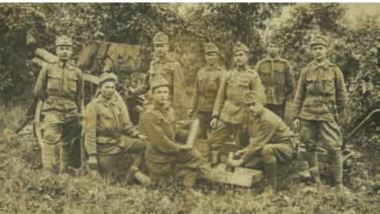
Tüzérek az I. vh. idején