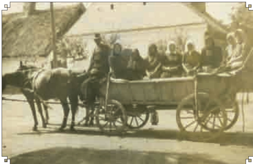
Csatkára induló zarándokok