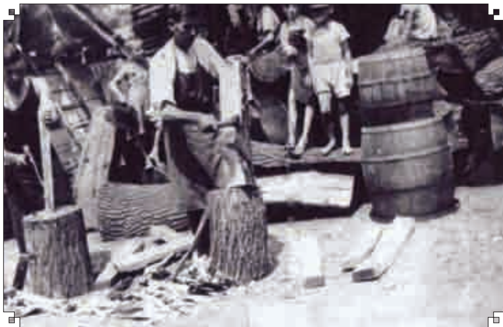
Hordókészítő kádárok – Balról Gulyás Károly