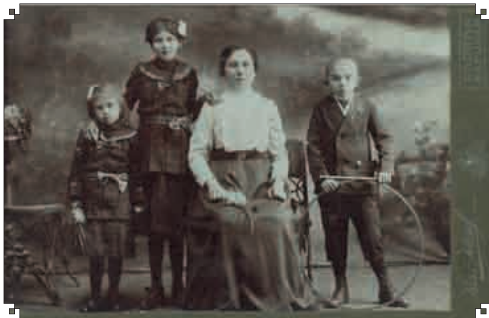
Budai család 1914