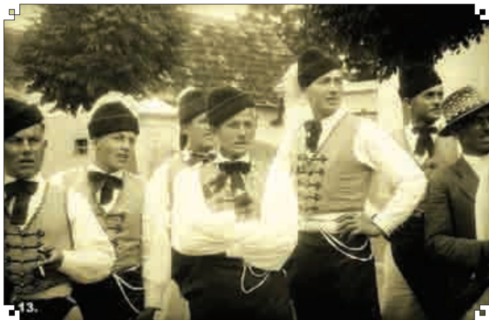
13. Filmes gyűjtés felvétele 1948-ból