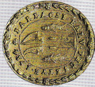
Helytörténeti Gyűjtemény Soproni Múzeum