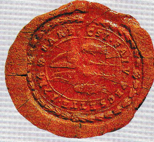
Urbanitália, felülvizsgálati iratok Községi Pecsétek Gyűjteménye GY/MS/MSI

A település első okleveles említése „Boborchs” néven 1270-ből származik, ekkor a királyi kincstár birtoka volt. A helynév eredete bizonytalan, talán az ószláv hód jelentésű főnév származéka. Később, 1390 után a Kanizsai, majd 1536 után a Nádasdy család a birtokosa. A Nádasdy-féle összeesküvés után 1671-ben a kincstár kobozta el, majd 1681-ben Esterházy Péter kezébe került. A lakosság a XVII. században halászatból élt, ekkor a sárvári Nádasdy birtokközpont halászkétséglettel teljes egészében a Barbacsi fő biztosította. Győr 1594-es elfoglalása kor a falut elpusztították. Az 1608-ban visszatérők már nem látták a régi faluhelyet, mivel azt a víz és a gaz foglalta el, új részen építették fel házaikat. Ekkor összesen hét család lakta a települést. A XVII. század végétől már búcsújáráhely volt 1704-ben a labancok oldalán harcoló rákok felégették a falut. Az 1767-es úrbéri rendezés a telki szántók területét csökkentette, viszont bevezették a háromnyomásos gazdálkodást a veszteséget az irásföld – családonként öt-hat hold – korlátozta. Végül 1768-ban egy új szerződést kötöttek a földesúrral a természetbeni szolgáltatásokat pénzzel megváltották. A barbacsi tavon a halászat nyereségének fele az Esterházyokat a nádaratsból pedig csak száz kévét követelt a földesúr, a többi a jobbágyokat illette. A birtokos 1855-ben az értékes iratokkal dekét visszavette és azokat értéktelenebb területekre szállította. A település lakossága 1785-ben 450, 1920-ban 1008, 2001-ben pedig 762 fő volt.