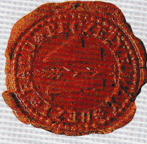
Községi Pecséttek Gyűjteménye ARCHIVUM VETUS GyMSMGYI