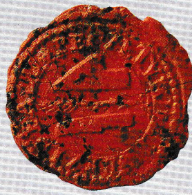
GyMSMGYI IV./A/1/H Urbéri iratok