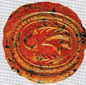
A pecsét egy másik lenyomata egy 1868-as keltezésű iraton

Urbarialia, felülvizsgálati iratok Községi Pecsétek Gyűjteménye GyMSMSL