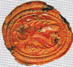
Cirák pecsétje 1775-ből

Urbarialia, felülvizsgálati iratok Községi Pecsétek Gyűjteménye GyMSMSL