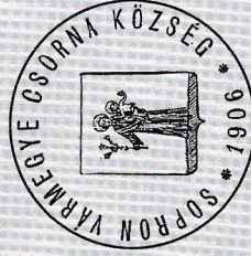
Községi Pecsétek Gyűjteménye MNL GyMSMSL

területénél követően az 1960-as években megindult Csorna egyre gyorsuló fejlődés bontakozott ki. Közül 1960-ból a lakosság és két és félszeresére a község lakosságának száma. Mezővárosi 1971. április 25-én Csornát városrássá nyilvání- tásáról készült az első városi címter.