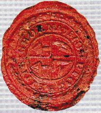
Urbarialia, felülvizsgálati iratok Községi Pecsétek Gyűjteménye MNL GyMSMSL