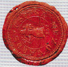
Községi Pecsétek Gyűjteménye MNL GyMSMSL

ában lángpallost, baljában mérteget ábrázoló pajzst tart. 1786-ból már egy másik pecsét ismert. A poncolt vonalok határolt kör alakú pecsét felirata a pecsétábra részével kaszoltan: CSOR – PP – VAR – PET. Feloldása CSORNAI P(REMONTRE)P(RÉPOSTSÁG) – VÁR(OSÁNAK) – PET(ET)P A pecsétábra: jobbajában lángpallost, baljában mórmezei ekevasat tartó Szent Mihály arkangyal.