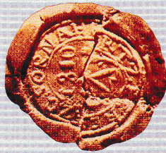
Községi Pecsétek Gyűjteménye MNL GyMSMSL