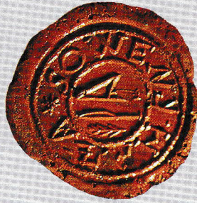
Magyar Országos Levéltár (MOL-V-5)