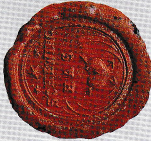
Községi Pecsétek Gyűjteménye ARCHIVUM VETUS Gy/MSMG/1