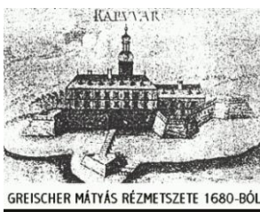
GREISCHER MÁTYÁS RÉZMETSZETE 1680-BÓL

Ide gyűjtötték és tárolták a várhoz tartozó falvak beszolgáltatott terményeit, a majorok gabonáját és a szentmiklósi szőlők borát. A vár körül kialakult katonatelep a 16. század közepén már mezőváros volt. 1587-ben 37 család lakta.