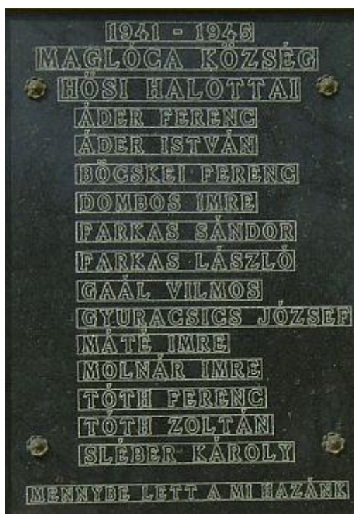
A falu II. Világháborúban elesett hősi halottai

A II. világháborúban 13 maglócai lakos áldozta életét. Az iskola leépítése is megkezdődött: 1946-tól a felső tagozatosok Barbacsra, és Bősárkányba jártak át, majd néhány év múlva csak Barbacsra, Maglócán 1–4 összevont osztály maradt egy tanítóval. 1975-ben teljesen megszüntették az iskolát és az önálló községi tanácsot.