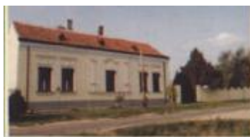
A falu egyik szép épülete

A zászló téglalap alakú, közepén a falu címerével. Színei a zöld és aranysárga a falut körülölelő természeti környezetet, zöld vetést és helyi réteket idézik. A címer alatt „Maglóca” felírat és az 1220-as évszám a falu első írásos említésének dátuma látható.