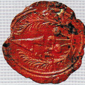
Községi Pecsétek Gyűjteménye GyMSMSL