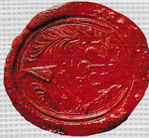
Községi Pecsétek Gyűjteménye GyMSMSL