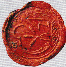
Községi Pecsétek Gyűjteménye ARCHIVUM VETUS GyMS/MGYL