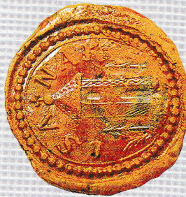
Községi Pecséték Gyűjteménye GYMSMSL