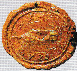
Urbariális, felülvizsgáló iratok Községi Pecséték Gyűjteménye GYMSMSL