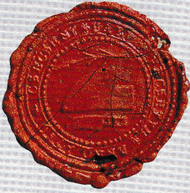
Községi Pecsétek Gyűjteménye ARCHIVUM VETUS GYMSMgyL