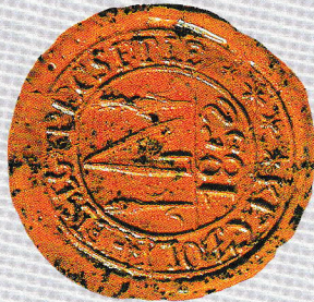
Magyar Országos Levéltár (MOL-V-5)