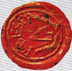
Urbanizáció, felülvizsgálati iratok Községi Pecsétek Gyűjteménye GYMSMSL