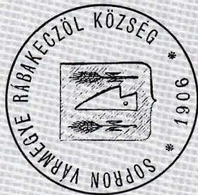
Községi Pecsétek Gyűjteménye GYMSMSL