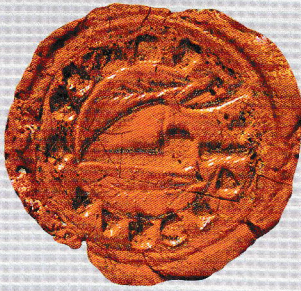
Urbanialia, felülvizsgálati iratok községi Pecsétek Gyűjteménye GYMSMSI