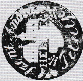
Községi Pecsétek Gyűjteménye GYMSMSI