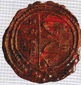
Községi Pecsétek Gyűjteménye ARCHIVUM VETUS GYMŞMŰGY

Első okleveles említése 1209-ből maradt fenn. „Capi” néven egy szóli eredetű, a magyar kapu főnév „i” képzős származéka. Az egykori határt védő gyepűrendszer átjárójának, kapujának emiatt kére utal. A megkülönböztető Rába előtag a folyó közeliségét jelöli. 1209-ben adományozta II. Endre Tóth mosoni főispán birtomlását. Tamas fiainak Kapi földjét, 1251-ben Mörctz mester nyitrai főispán a saját részét a mórchidai prépostságnak adományozta. Az 1300-as években a Kapy, az 1500-as években az Enyingi Frank család a birtokos. 1554-ben a budai apácák mellett, a most apácák is birtokosai, de az 1609-es összeírás a nagyszombathelyi Káriszákai is említi. 1848 előtt úrbéres község volt. 1783-ban 254 lakosa volt, 2001-ben 180-an éltek itt.