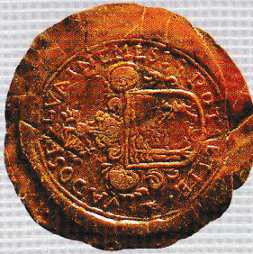
Magyar Országos Levéltár (MOL-V-5)