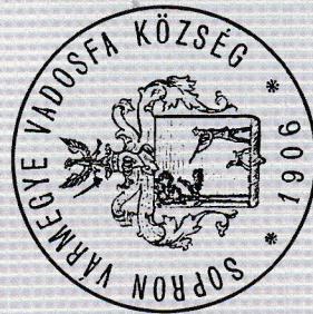
Községi Pecsétek Gyűjteménye GyMSMSI