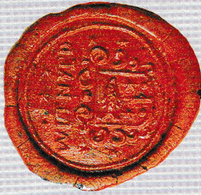
Urbarialia, felülvizsgálati iratok Községi Pecsétek Gyűjteménye Gy/MS/MSI