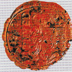
Községi Pecsétek Gyűjteménye Gy/MS/MSI